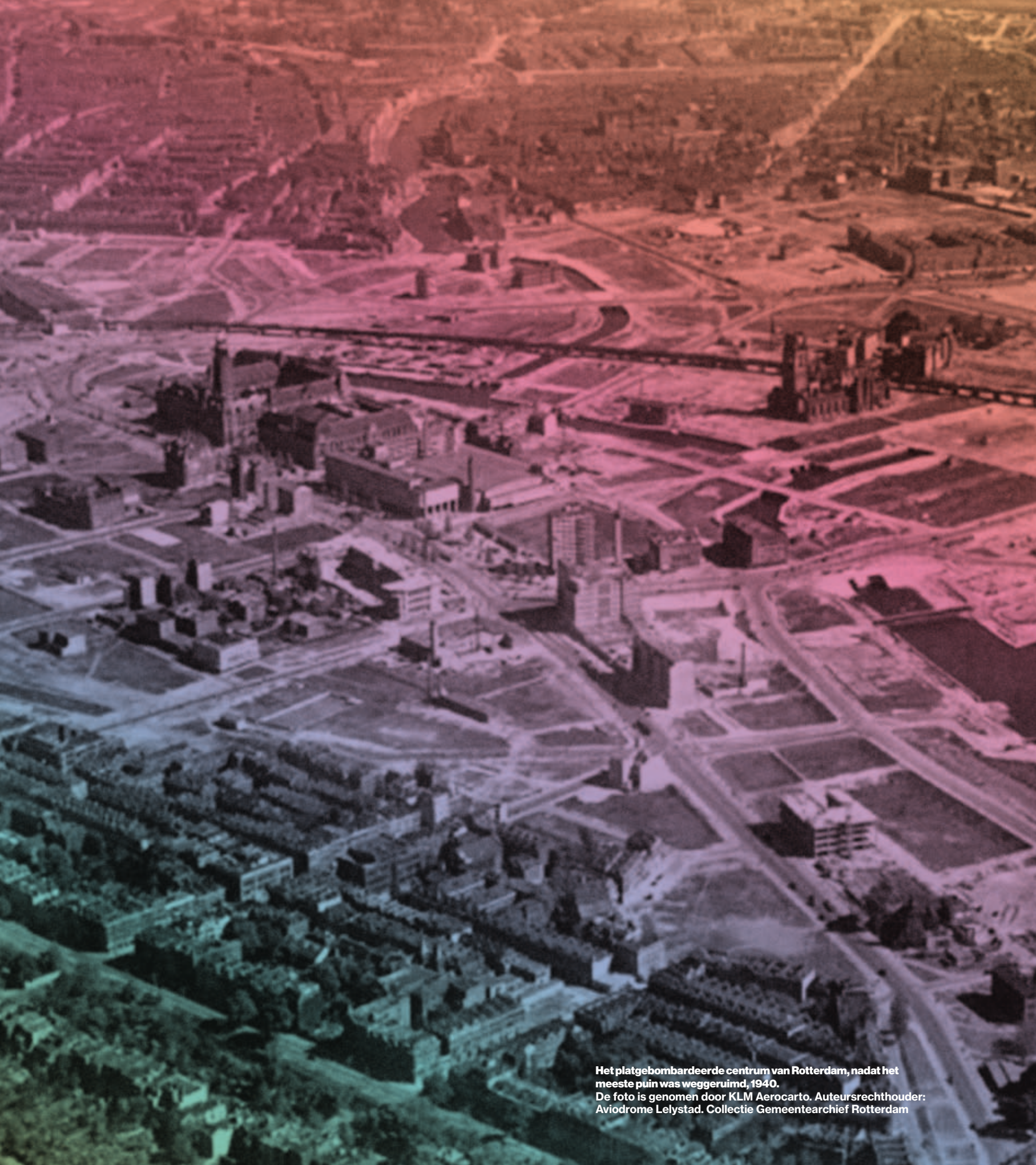
Het platgebombardeerde centrum van Rotterdam, nadat het meeste puin was weggeruimd, 1940.