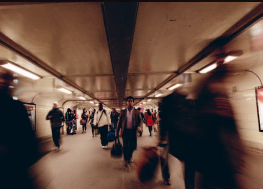
Rotterdam Centraal Station (voetgangerstunnel)

Geboren 1942 in New York, VS. Woont en werkt in Amsterdam en New York.